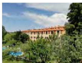
S – Seia – Qta. do Crestelo Maio – 3 dias