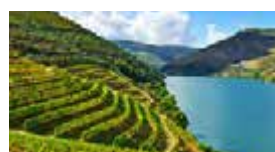
N – Alto Douro e Beira Baixa – Convívio de Reformados Junho – 4 dias