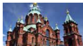
S – Helsínquia e S. Petersburgo Junho – 6 dias