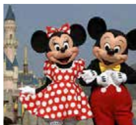
S – Disney Abril – 4 dias

No entanto, se preferir uma viagem por medida, à sua medida, por favor não deixe de consultar o Grupo Desportivo. Somos capazes de o surpreender.