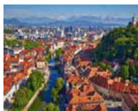
S – Eslovénia Abril – 6 dias