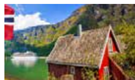
N – Todos os Fiordes Maio/Junho – 8 dias