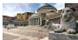
N – Sul de Itália, Puglia e Sicília Julho – 12 dias