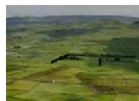
S – Açores – Encontro com Reformados Setembro – 5 dias