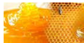
S – Feira do Mel e da Castanha Novembro – 3 dias