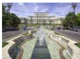
S – Roménia Maio – 8 dias