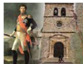
S – Por terras de Fronteira Outubro – 3 dias