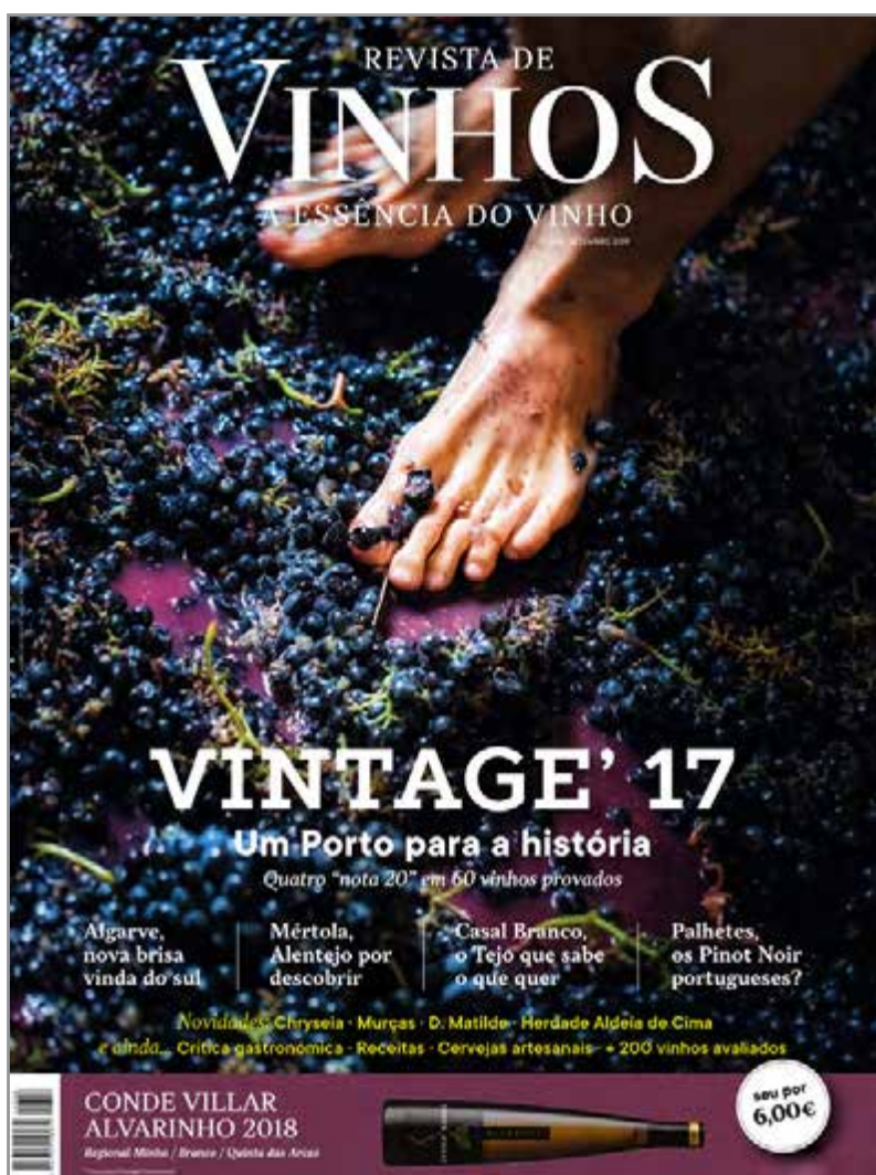
Imagem da capa da Revista de Vinhos