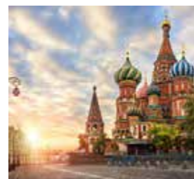
N – Rússia Imperial Setembro – 7 dias